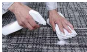
シミ取り(早期発見→対処が重要です)

汚れの80%は乾いた粒子の汚れです。毎日のアップライトバキュームで除去。(出入り口付近は縦、横と2回かけてください)