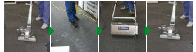
バキューム 特殊洗剤散布 ロータリーブラシ洗浄 汚れを吸着した洗剤を回収