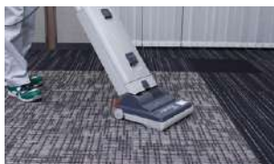
掃除機バキューム

汚れの80%は乾いた粒子の汚れです。毎日のアップライトバキュームで除去。(出入り口付近は縦、横と2回かけてください)