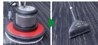
洗剤を出しながら洗浄 水または温水でリンス→乾燥

※衛生消毒薬品は必ず事前に目立たない箇所では影響の無いことを確認してから使用してください。状況によりメンテナンスの頻度は異なりますので、必ず専門業者へご確認ください。