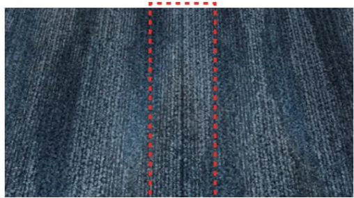
ロールアップ同士をジョイントした場合