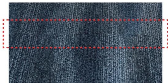
タテリピートを合わせてジョイントした場合 ※柄が正確には合いません。