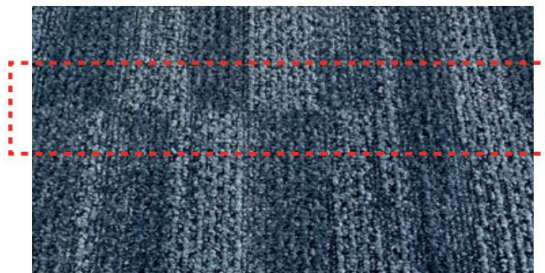
リピートを合わせずジョイントした場合