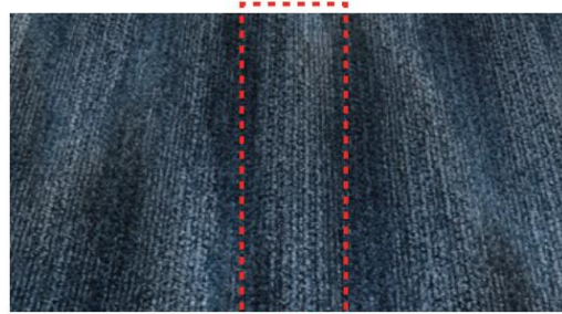
ハイループ同士をジョイントした場合