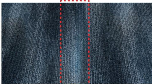
グラデーション部分

商品の染色リピートはタテ360cmヨコ180cmとなります。 ランダムな柄表現にするため特殊な染色方法を用いており、ジョイント施工の際柄が正確に合いません。 グラデーション部分が色ムラに見ることがありますが、デザイン上の特性としてお含みおきください。